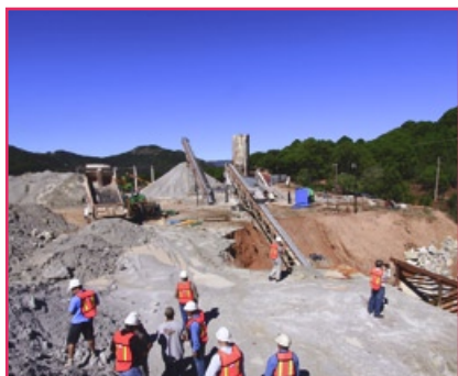
Produktionsbeginn Mexoro Oktober 2009