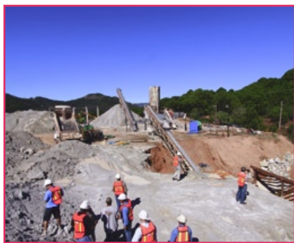
Produktionsbeginn Mexoro Oktober 2009