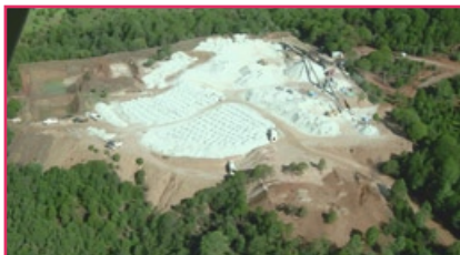
Cieneguita Gelände Weiches Material